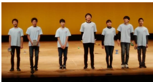
津市青少年文化芸術祭(2020. 1月)