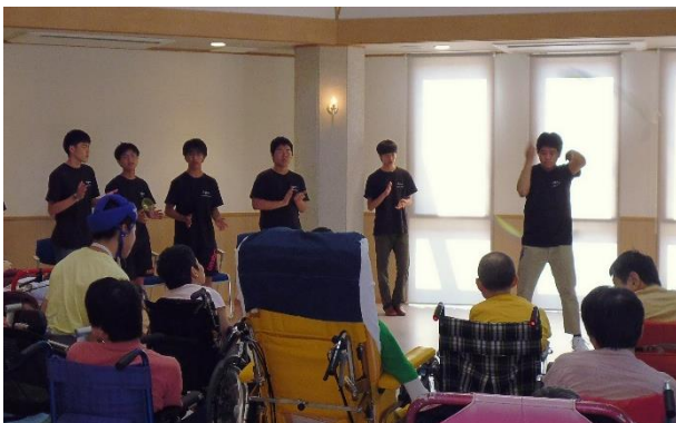
嬉野カトリックの家(2018. 6月) ポイ

安濃津ロマン(津市) 東桜が丘地区子ども会イベント(津市) 津高図書館ライブ 津市青少年文化芸術祭