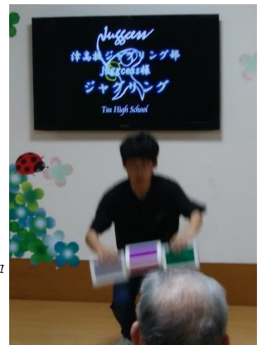
安濃津ロマン (2019. 6月) シガーボックス