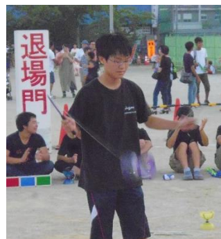
しんまち夏祭り(2018. 8月)ディアボロ