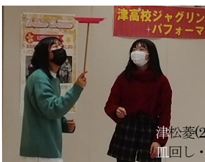
津松菱(2021. 12月) 皿回し・ディアボロ