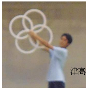
津高校文化祭(2020. 9月) エイトリング